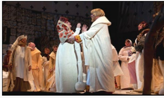
1) А) БАЛЕТ